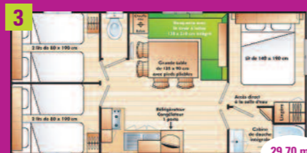
3 Cottage Famille 3 chambres (6 places) 3 chambres, salon, banquette, cuisine, douche et WC, télévision, terrasse, salon de jardin