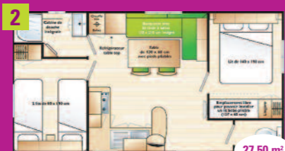
2 Cottage Bretagne 2 chambres (4 places) 2 chambres, salon, banquette, cuisine, douche et WC, télévision, terrasse, salon de jardin