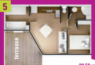
5 Chalet RÊVE 4 places 2 chambres, salon, banquette, cuisine, douche et WC, télévision, terrasse, salon de jardin