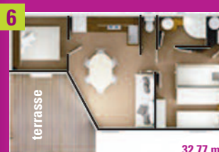
6 Chalet RÊVE CONFORT 5 places 2 chambres, salon, banquette, cuisine, douche et WC, télévision, terrasse, salon de jardin