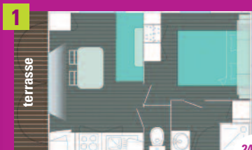
1 Cottage Corsaire 1 chambre (2 places) 1 chambre, salon, banquette, cuisine, douche et WC, télévision, terrasse, salon de jardin

RÉSERVATION EN LIGNE SUR : www.camping-vieuxchene.fr